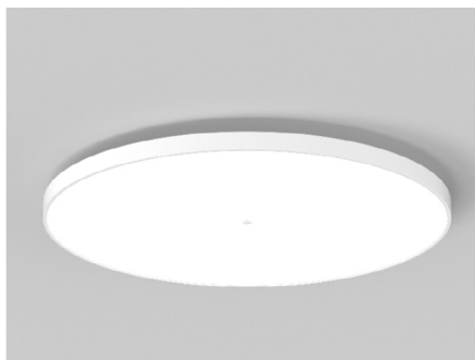
SUPER SIGN AURA

Zusammen mit Tom Schuster als Innenarchitekt wurde der O. Küttel AG das Beleuchtungskonzept anvertraut. Die grossflächige SUPER SIGN AURA sorgt in Kombination mit den SING ROUND Leuchten für warmes und angenehmes Grundlicht in den Räumen. Die kubischen Wandanbauleuchten vom Typ DICE WALL setzen zusätzlich verspielte Akzente.