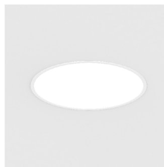
SIGN ROUND EB

2017 hat man sich für ein neues «Kleid» der Cafeteria entschieden. Die neue Möblierung kommt frisch daher und wird durch die auffälligen GLORIOUS Leuchten modern in Szene gesetzt. SIGN ROUND Leuchten ergänzen die Beleuchtung punktuell.